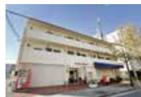
西宮浜甲子園郵便局 徒歩 約8分 (約600m)