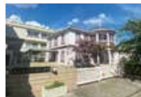
今津小学校 徒歩 約24分 (約1,900m)