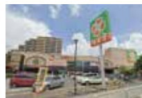
ライフ浜甲子園店 徒歩 約13分 (約1,000m)