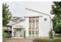
中田内科医院 徒歩 約13分 (約1,000m)