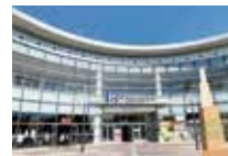
ららぽーと甲子園 徒歩 約15分 (約1,200m)

※このハウジングマップは概要紹介図です。図面と現況が異なる場合は現況優先となります。