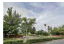
浜甲子園運動公園 徒歩 約5分 (約350m)