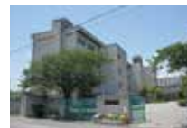
真砂中学校 徒歩 約12分 (約950m)