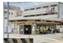
ローソン西宮甲子園九番町店 徒歩 約12分 (約950m)