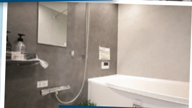
新調した綺麗な浴室