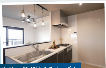
家族の顔が見えるキッチン